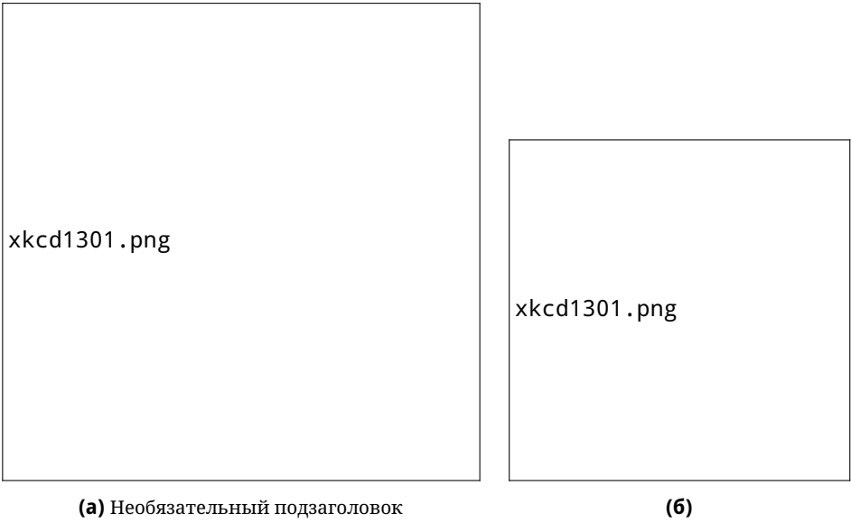
Рис. 2. Пример двух изображений рядом на одном рисунке